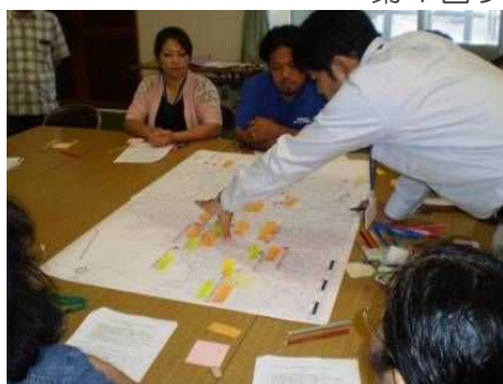
第1回ワークショップ風景

下地改善センターにて「第1回バリアフリー基本構想ワークショップ」を開催し、17名の方に参加いただき、2グループに分かれて意見を出し合っていました。